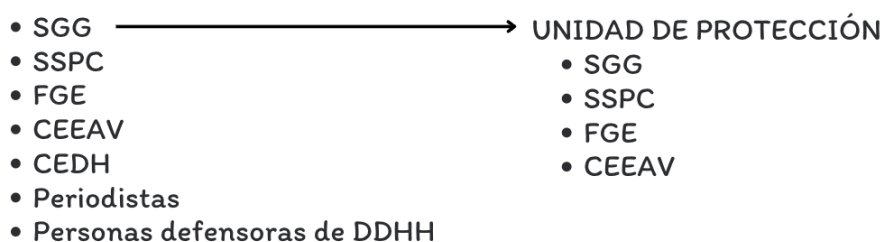
Gráfico 2. Estructura del Mecanismo Estatal de protección a periodistas y personas defensoras de DDHH.