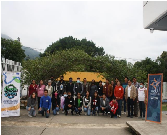
Fotografía 10. Compartencia en Matlapa. noviembre 2022.

garantiza la sostenibilidad del campo, sino que también fomenta una economía más equitativa y colaborativa, basada en el esfuerzo conjunto de las comunidades rurales.