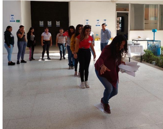
Fotografía 7. Encuentro presencial. Rioverde, octubre 2022.

Se reflexionó sobre cómo la mayoría de los servicios esenciales, como los de salud, los administrativos, los educativos, así como las oportunidades laborales más atractivas en términos de sueldo y crecimiento profesional, están centralizados en las grandes ciudades. Esta centralización no solo representa una problemática entre la capital y los demás municipios, sino que afecta especialmente a las personas que residen en comunidades más alejadas, fuera de las cabeceras municipales. En algunos casos, la opción de migrar hacia las ciudades se convierte en una obligación, no en una decisión, ya que las condiciones del entorno y la falta de opciones locales les obligan a hacerlo. Este fenómeno genera una serie de nuevas problemáticas, como la vulnerabilidad económica, la pérdida de vínculos familiares y comunitarios, y la exposición a nuevas formas de discriminación, lo que agrava aún más las desigualdades sociales y económicas.