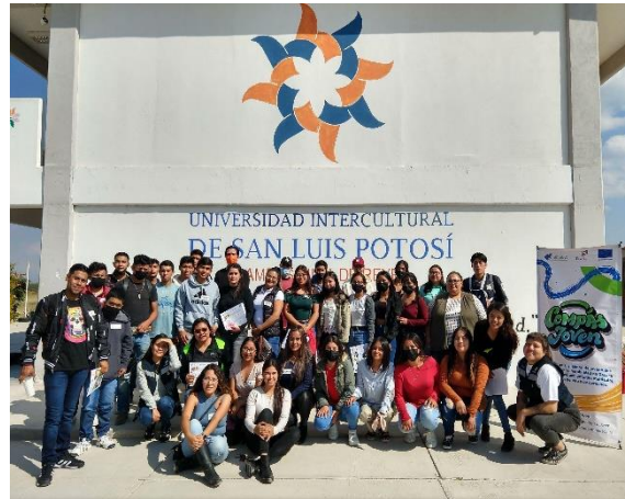
Fotografía 1. Alumnado de la UICSLP campus Villa de Reyes. Encuentro presencial, noviembre 2022.

Las juventudes enfrentan múltiples desafíos tanto en el ámbito laboral formal como en el informal, los cuales afectan su estabilidad económica y desarrollo profesional. En el caso del trabajo informal, uno de los problemas más comunes es la ausencia de contratos que garanticen la continuidad de ingresos y condiciones laborales estables, lo que conduce a una alta rotación en los empleos, poca estabilidad económica y dificultades para planificar a largo plazo.