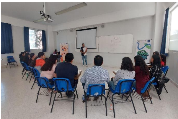
Fotografía 6. Encuentro presencial, Rioverde, octubre 2022.

Se concluyó que, en muchos entornos laborales, el acoso, abuso o violencia sexual hacia las mujeres se normaliza bajo la amenaza de perder el empleo o ciertos derechos, lo que dificulta las denuncias y, cuando se presentan, a menudo se revictimiza a las afectadas. Para combatir esto, se considera esencial establecer códigos administrativos o laborales enfocados en la prevención de la violencia y el abuso sexual, así como capacitar y