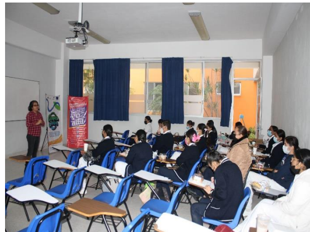
Fotografía 4. Encuentro presencial. Rioverde, octubre 2022.

Las personas jóvenes en el ámbito laboral se enfrentan a múltiples desafíos arraigados en prejuicios y desigualdades. En muchos contextos, se asume que, al no tener responsabilidades familiares, están disponibles para jornadas laborales extenuantes y bajos salarios. Esta percepción los coloca en una posición desventajosa, al ser vistos como mano de obra temporal o para tareas poco valoradas. El adultocentrismo permea los espacios laborales, generando discriminación basada en la edad y, en el