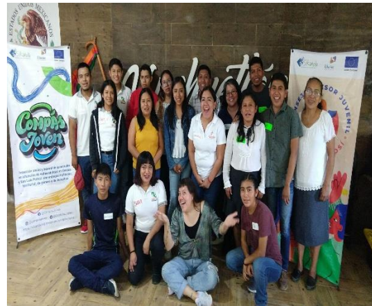
Fotografía 8. Encuentro presencial. Huehuetlán, octubre 2022.

Se destacan algunas de las acciones que las y los participantes consideran urgentes o esenciales para abordar en sus contextos locales. Estas acciones reflejan las necesidades inmediatas y las prioridades que deben ser impulsadas para mejorar las condiciones de vida y trabajo de las juventudes. Este ejercicio se configura como un paso previo crucial para la creación de una agenda más amplia y estructurada, enfocada en la inclusión sociolaboral de las juventudes, que permita generar propuestas concretas y estrategias eficaces para garantizar su pleno acceso a oportunidades laborales dignas y su participación activa en la vida social y económica.