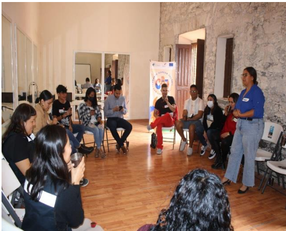
Fotografía 11. Compartencia en Cerritos, diciembre 2022.

Realizamos la segunda Compartencia en el municipio de Cerritos, donde una joven integrante del Consejo Asesor Juvenil fue clave para reunir a actores de diversos ámbitos que promueven acciones significativas relacionadas con el trabajo digno de la región.