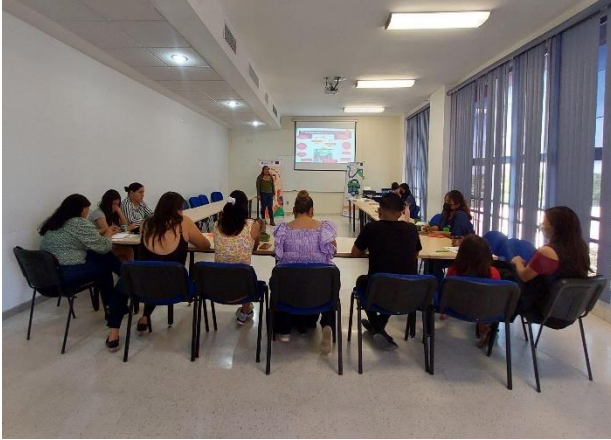
Fotografía 2. Encuentro presencial. Ciudad Valles, octubre 2022.

Las personas jóvenes, a menudo, enfrentan barreras significativas al ingresar al mercado laboral. Se les percibe como inexpertas y se desconfía de sus capacidades, lo que limita sus oportunidades. Esta discriminación se agrava por factores como el origen étnico o la lengua materna, perpetuando desigualdades. Si bien se reconoce la importancia de integrar a jóvenes al ámbito laboral, es fundamental garantizar condiciones laborales justas y dignas. Sin embargo, persiste la subvaloración de su trabajo, manifestándose en bajos salarios