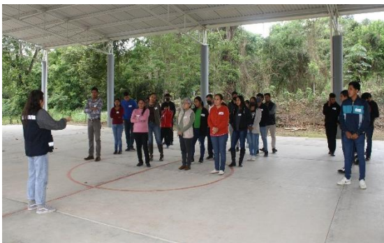
Fotografía 9. Compartencia en Matlapa, noviembre 2022.

En Matlapa llevamos a cabo la primera Compartencia, un espacio de encuentro que nos permitió dialogar con un amplio grupo de personas participantes del diplomado virtual, así como con actores locales reconocidos por sus iniciativas en economía comunitaria, especialmente enfocadas en las mujeres.