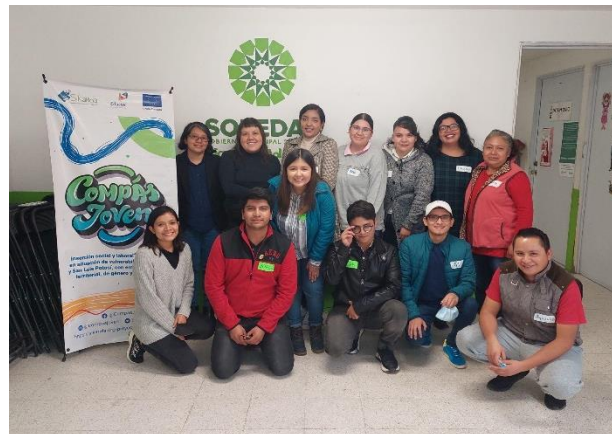
Fotografía 3. Encuentro presencial. Soledad de Graciano Sánchez, octubre 2022.

Las personas jóvenes, especialmente las mujeres, enfrentan múltiples barreras al ingresar al mercado laboral. Los estereotipos de belleza y las expectativas corporales limitan las oportunidades profesionales de muchas mujeres jóvenes. Además, tanto las empresas como los espacios de trabajo suelen carecer de las herramientas y la sensibilidad necesarias para reconocer y potenciar las habilidades de las nuevas generaciones. Por otro lado, la falta de participación de las juventudes en los espacios de toma de decisiones políticas genera políticas públicas desconectadas de sus