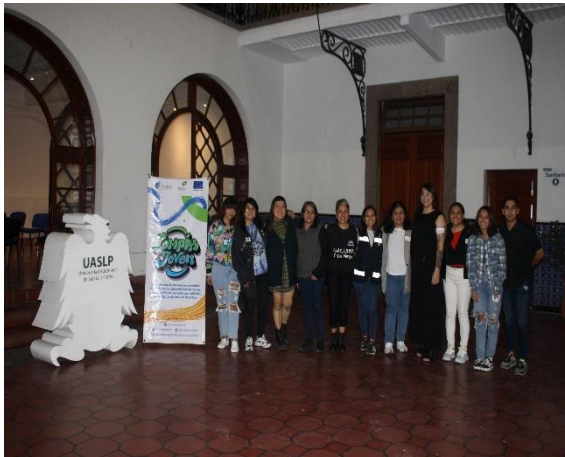
Fotografía 14. Compartencia en San Luis Potosí, diciembre 2022.

Otro de sus programas destacados es “Estímulos a la Educación Superior”, el cual brinda apoyos económicos mensuales a jóvenes para fomentar su permanencia en espacios educativos, promoviendo así su desarrollo académico y profesional.