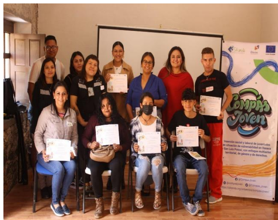
Fotografía 12. Compartencia en Cerritos, diciembre 2022.