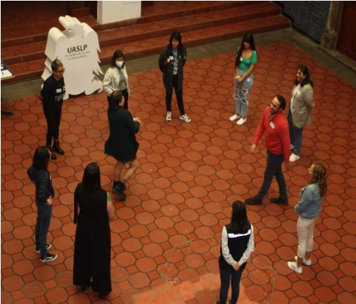
Fotografía 13. Compartencia en San Luis Potosí, diciembre 2022.

Finalizamos el bloque de Compartencias en San Luis Potosí, donde hay una amplia diversidad de personas organizadas realizando acciones para promover los derechos laborales de las personas jóvenes y señalando prácticas adultocéntricas en espacios para el trabajo privados y públicos.