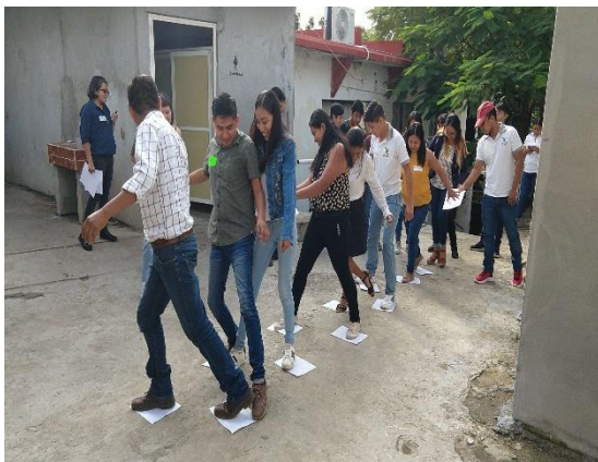
Fotografía 5. Encuentro Presencial. Huehuetlán, octubre 2022.

Las creencias culturales arraigadas, limitan a las mujeres a roles tradicionales, como el cuidado de la familia, un trabajo frecuentemente no remunerado. Esto las priva de ingresos suficientes para su sustento y para asegurar su futuro. Es urgente cambiar estos estereotipos laborales, comenzando desde la educación básica y extendiéndose a los espacios de trabajo. Además, es fundamental garantizar trabajo digno, bien remunerados y seguros para las mujeres. También es necesario ofrecer apoyo psicoemocional a aquellas que han sufrido violencia laboral, para que puedan recuperar su confianza y sentirse seguras nuevamente.